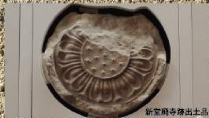
新堂廃寺跡出土品